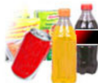
Essen & Trinken