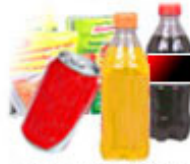
Essen & Trinken